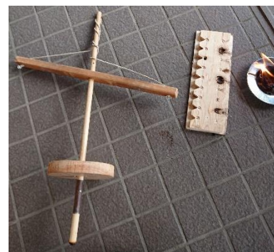
舞錐式で使用する道具です。

身近に火があることは大事なことです。 お子様、お孫様と一緒に火おこしを体験をしてみませんか。火おこし器のキットはインターネット通販サイトでも3,000~4,000円程度で販売されています。ご興味ございましたら購入されてみてはいかがでしょうか。